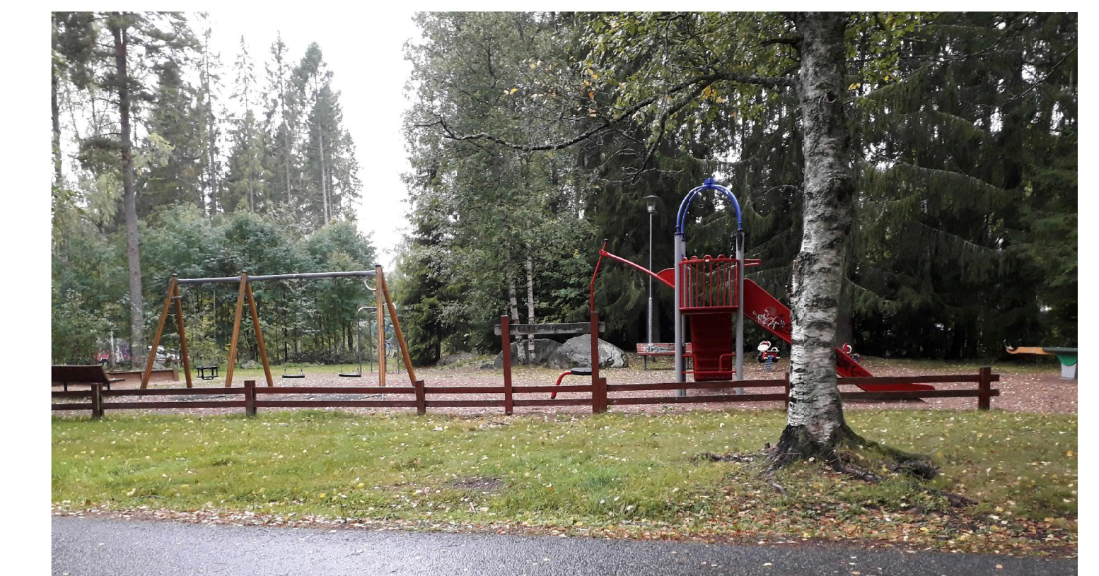
Niittäjäntielle juoksuva estävä kaidemainen puuaita korvataan matalalla metalliaidalla.

Niittäjänpuiston kunnostuksen yhteydessä poistetaan Akanpuiston leikkipaikka yhdyskuntalautakunnassa 2020 hyväksytyn Leikkipaikkaohjelman mukaisesti.