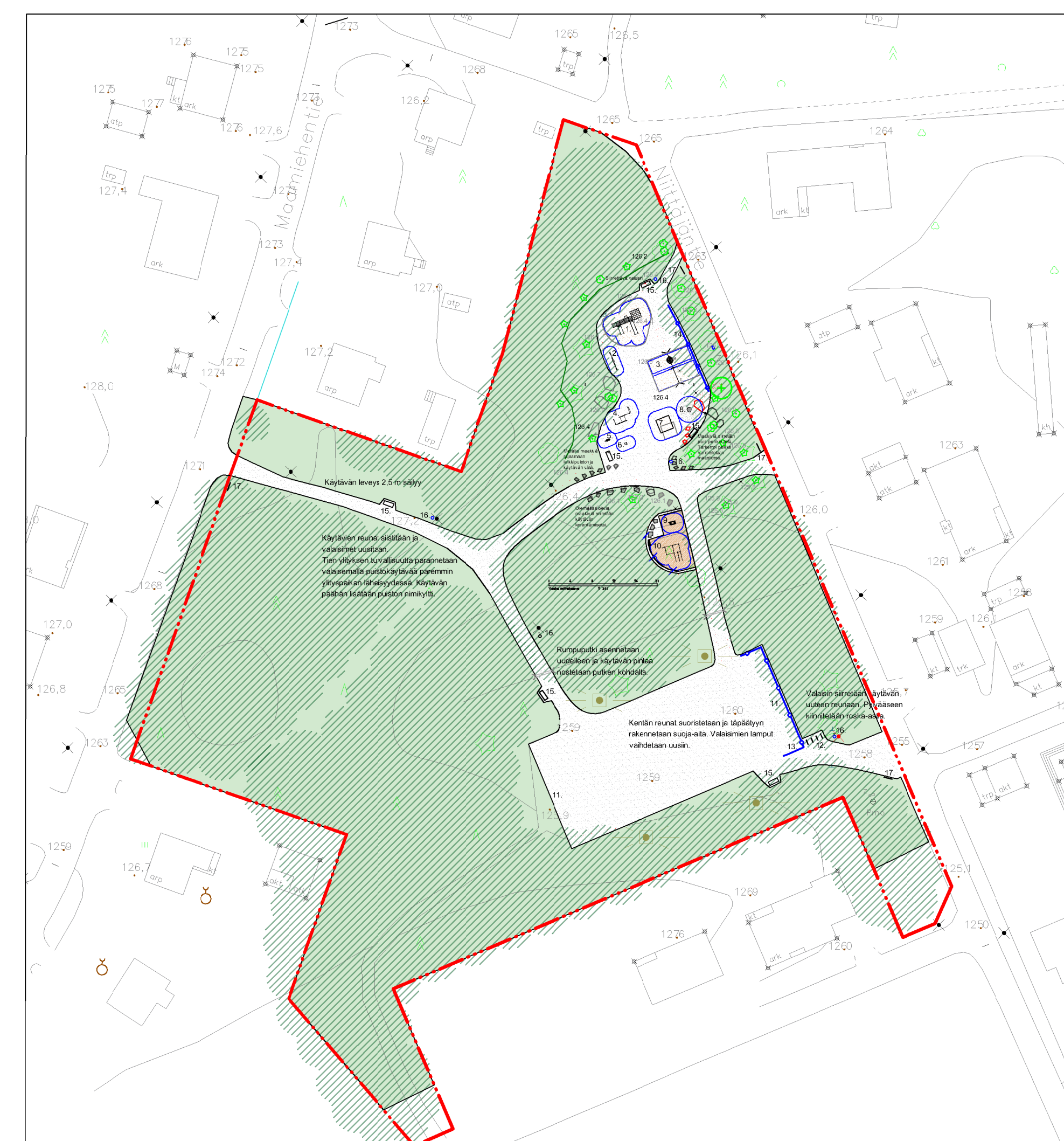
Niittäjänpuisto kokonaisuudessaan mittakaavassa 1:500